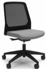
220B / 210B