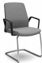
550B / 570B

DE_Konferenzstühle, Besucherstühle EN_Conference chairs, visitor chairs FR_Sièges visiteur et de réunion NL_Conferentie- en bezoekersstoelen ES_Sillas de conferencia, confidentes IT_Sedie de conferenza, seduta visitatori