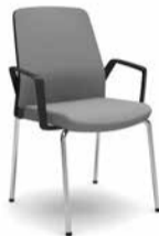
450B / 470B