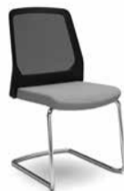
520B / 500B