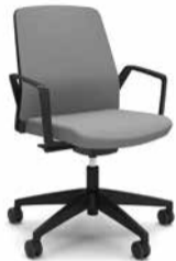
260B / 270B