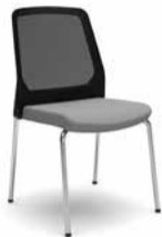
420B / 400B